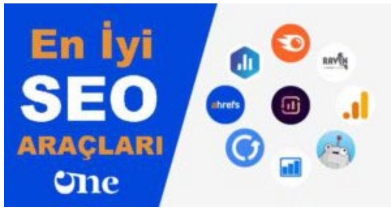
En Başarılı SEO Araçları