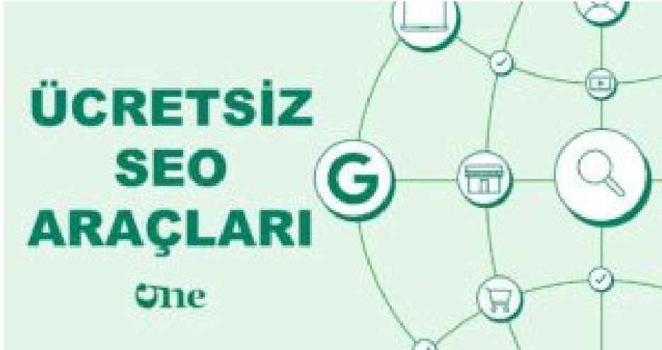
Ücretsiz SEO Araçları

Bu araç, bir web sitesinin SEO performansını analiz etmek için kullanılır ve web sitenizi optimize etmek için öneriler sunar.