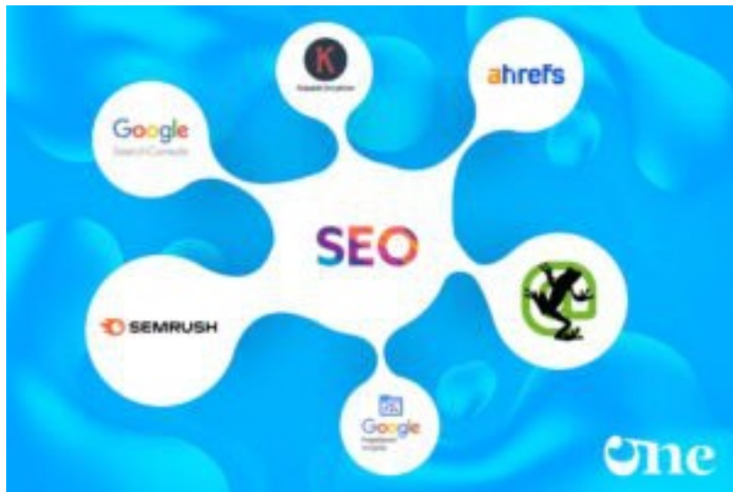
En Popüler SEO Araçları

Bu araç, anahtar kelime araştırması yapmanızı, web sitenizi optimize etmenizi ve trafiğinizi artırmanızı sağlar.